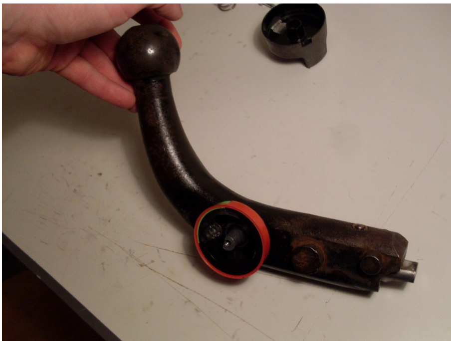
Figur 5. Lagerhus återmonterat.