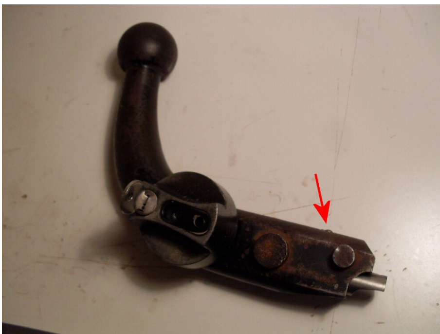
Figur 7. Låstunga ute (låst läge), indikatorpinne nertryckt (vid pil).