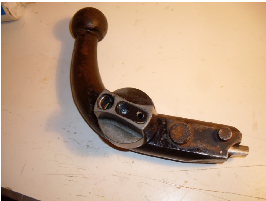
Figur 6. Vred återmonterat.