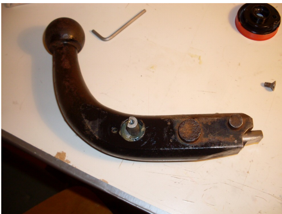
Figur 4. Låstunga med övrig mekanism återmonterat.