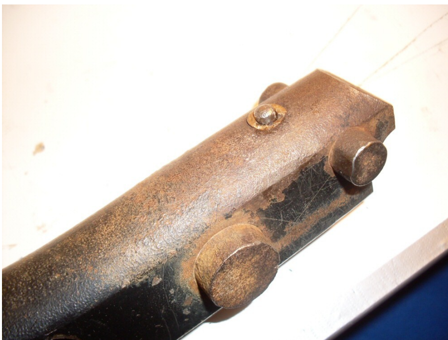
Figur 3. Indikatorpinne inne.