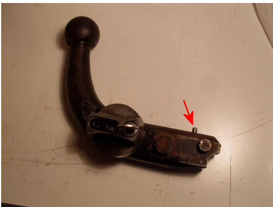
Figur 8. Låstunga inne (olåst läge), indikatorpinne uppe (vid pil).